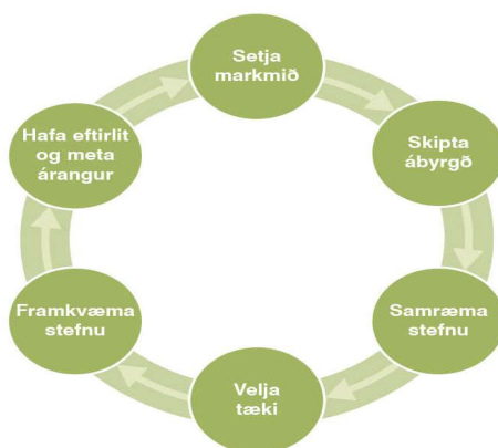
Mynd 2. Mótun menningarstefnu

Menning, sem hegðun fólks í margar kynslóðir hefur mótað, elur af sér afstöðu til annarra lífsgilda sem hafa meðal annars að geyma hófsemi, heimspeki, trú, náungakærleik og heilbrigða lífshætti og er vænleg leið til hamingju. Það er hægt að móta stefnu til að ná þessum markmiðum. Nútíma stefnumótun byggir á tiltekinni aðferðafræði um skipulögð vinnubrögð, samanber mynd 2.