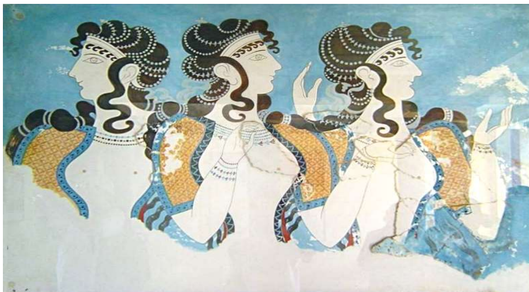
Mynd 4. Bláklæddu konurnar frá Knossos (freska frá því um 1450 f.Kr. sem er í safni í Herakleion á Krít)

Hin mínóska menning var lögð í rúst vegna náttúruhamfara og innrása karlmanna, meðal annars frá Grikklandi. Grikkir yfirtóku menningu Krítverja sem blandaðist svo þeirra eigin menningu svo úr varð hin gríska menning sem náði hápunkti um 500 f.Kr. Grísk menning varð síðan undirstaða allrar menningar á Vesturlöndum og reyndar víðar um heiminn. Sá ávöxtur spratt úr samfélagi án öfga.